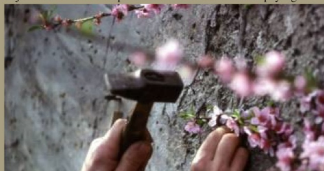
Rencontre avec le réalisateur

Ce documentaire d'Alain Tyr propose une balade champêtre inédite aux portes de Paris et un autre regard sur la ville où il vit et travaille : la nôtre. Enfant de Montreuil et des Murs à pêches, le réalisateur chemine dans ces espaces parcellaires, et labyrinthiques à la rencontre de ceux qui aujourd'hui essaient de préserver et de faire revivre ce paysage.